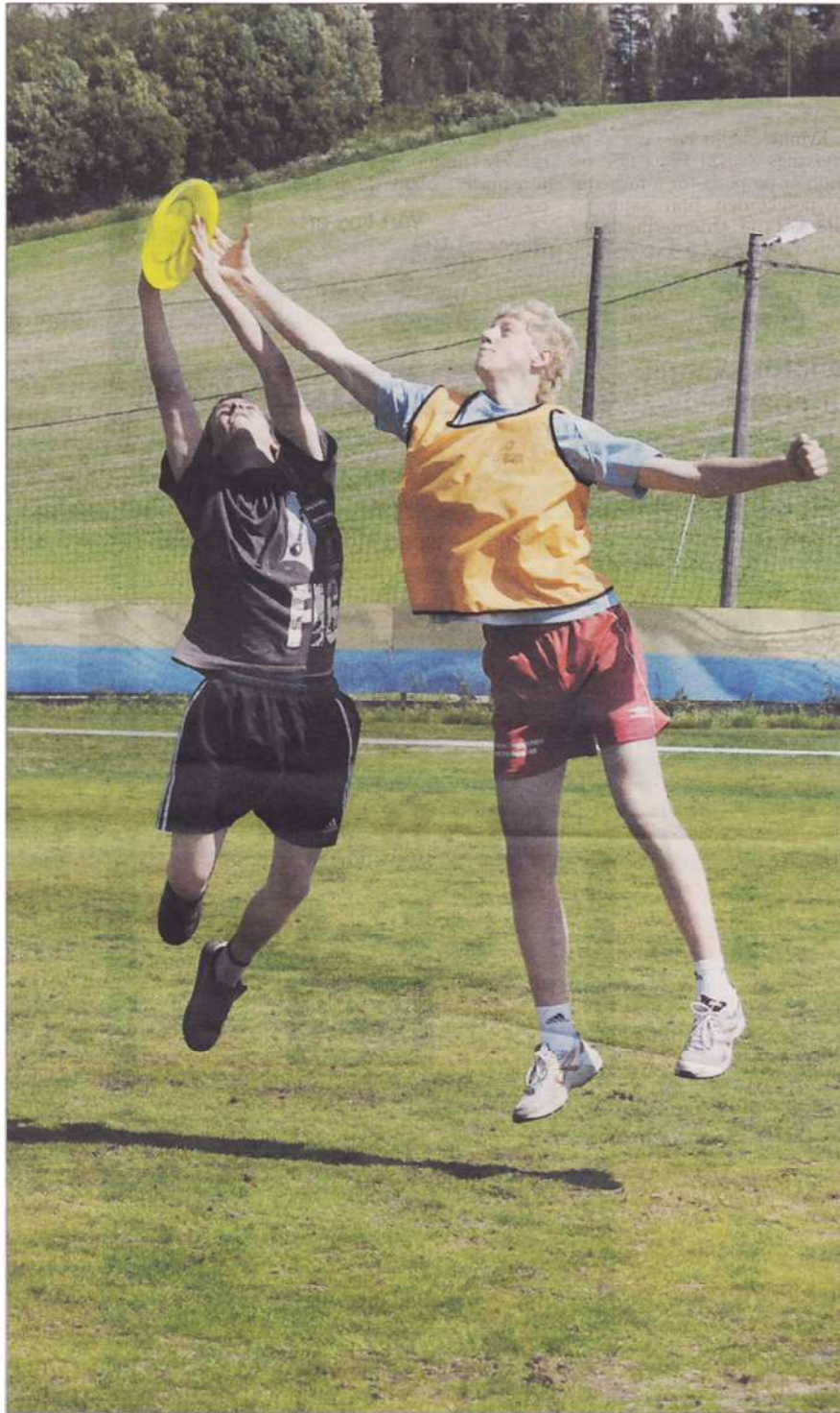
HARD KAMP: Veienmarka-laget kjempet hardt, og klarte nesten å slå Bingsfoss-elevene.

- Det var morsommere enn vi hadde trodd. Vi har bare hatt én trening, men nå er det bestilt mange frisbeer til skolen, så det blir sikkert mer spill, sa fornøyde Veienmarka-elever.